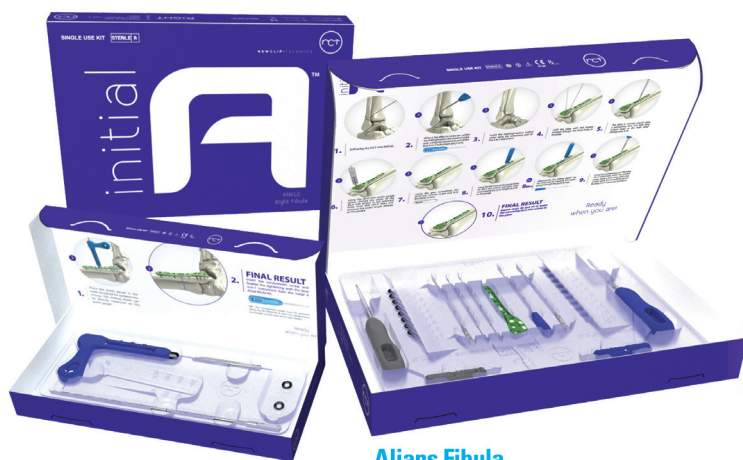
Alians Fibula Premier kit jetable