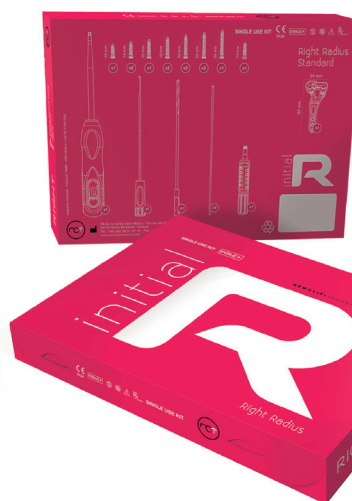
Alians Radius Distal Premier kit jetable